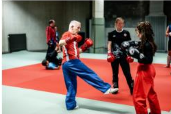
zich inschrijven bij een lokale sportclub