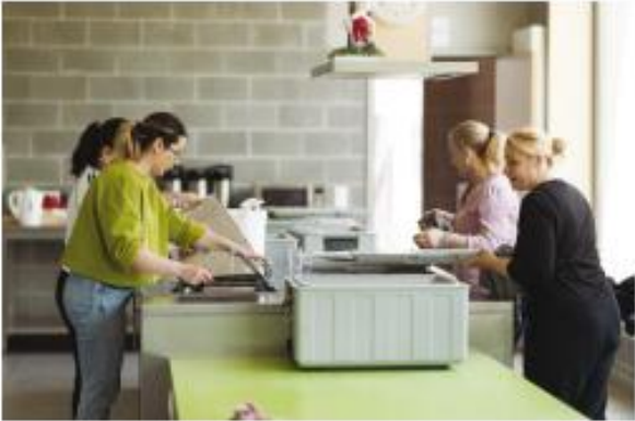
een kennismakingsstage doen bij een bedrijf