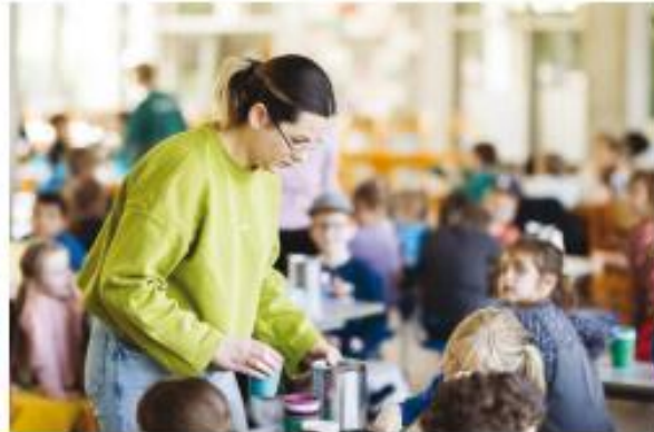
samen met andere ouders helpen op de school van hun kinderen