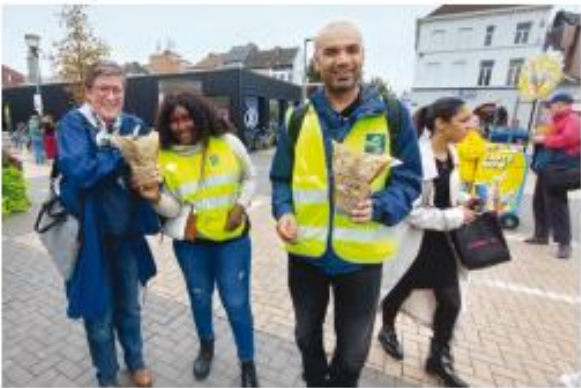
als vrijwilliger meewerken bij een evenement of in een vereniging