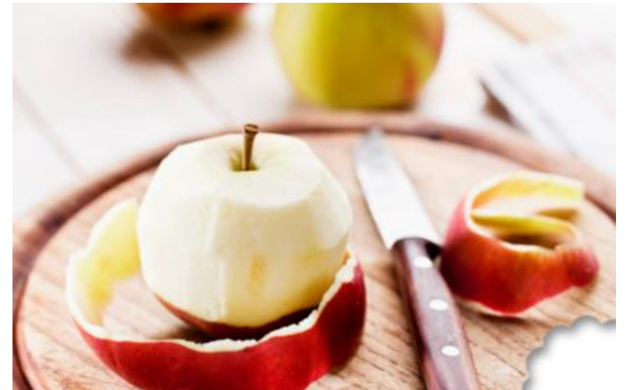
Fruitschillen samen met andere ouders ( i.s.m. Gentse basisscholen)