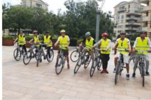
een cursus volgen om iets nieuw te leren (bijvoorbeeld fietsen, digitale vaardigheden)