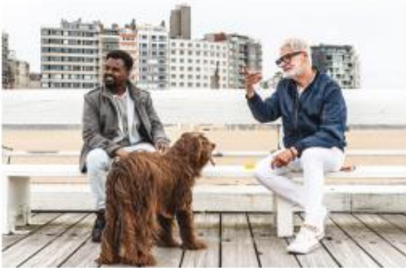
met een buddy op stap gaan