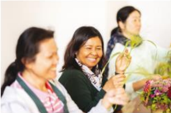
deelnemen aan de activiteiten van lokale verenigingen